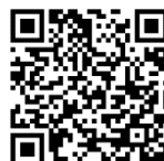
游於藝網站使用說明影片