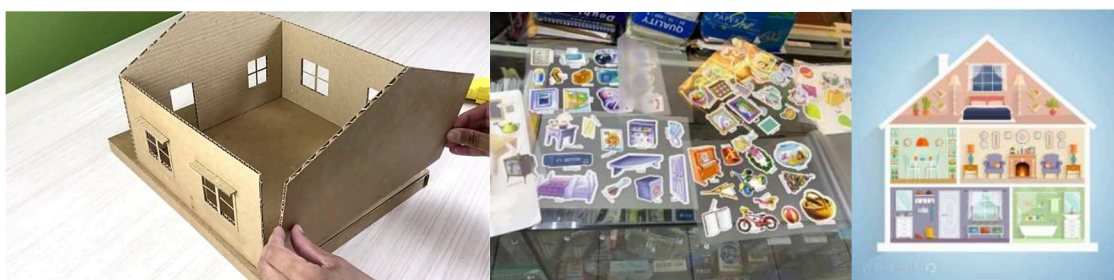
圖：種子教師未來授課可用教具-模型屋紙板與護貝圖卡

經與專業教師深入討論後，已擬定了針對國中學生的教學課綱。系列課程將包括 20 堂課，共計 900 分鐘，涵蓋講授、互動討論及手作體驗。為了確保參與本次培訓的種子師資能夠有效地將智慧淨零生活科技知識應用於後續的課堂教學，將於此時段對智慧淨零科技生活應用課綱進行詳細解說。此外，我們也會介紹教師在授課時可用的教材，供未來教學參考與調整使用。