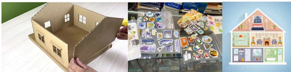
圖：種子教師未來授課可用教具-模型屋紙板與護貝圖卡

經與專業教師深入討論後，已擬定了針對國中學生的教學課綱。系列課程將包括 20 堂課，共計 900 分鐘，涵蓋講授、互動討論及手作體驗。為了確保參與本次培訓的種子師資能夠有效地將智慧淨零生活科技知識應用於後續的課堂教學，將於此時段對智慧淨零科技生活應用課綱進行詳細解說。此外，我們也會介紹教師在授課時可用的教材，供未來教學參考與調整使用。