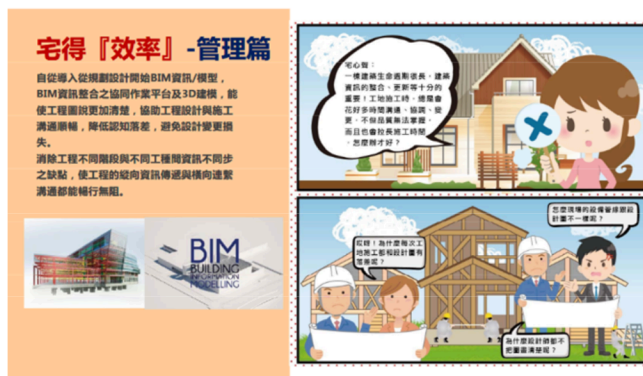
圖：智慧化居住空間展示數位電子書圖文內容

編撰理念，使種子教師了解未來授課時可以利用的資源及其背後的原理，從而幫助他們更有效地推動相關課程。