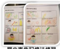
歷史事件記憶法練習