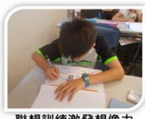
聯想訓練激發想像力