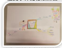
心智圖社會科筆記練習