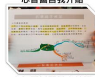
心智圖抓關鍵字練習