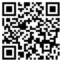
報名網站 QR CODE

【110相聲比賽專區】網址 http://app.stps.tp.edu.tw/crosstalk/