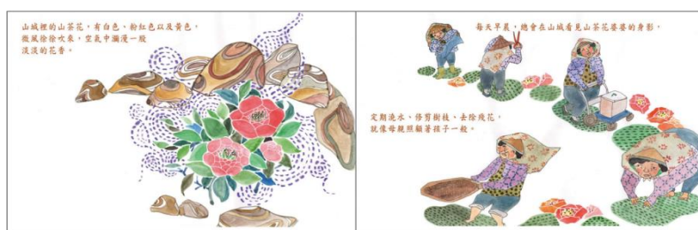
※範例作品：教育部反毒繪本—山茶花婆婆/洪孟真、呂舒婷