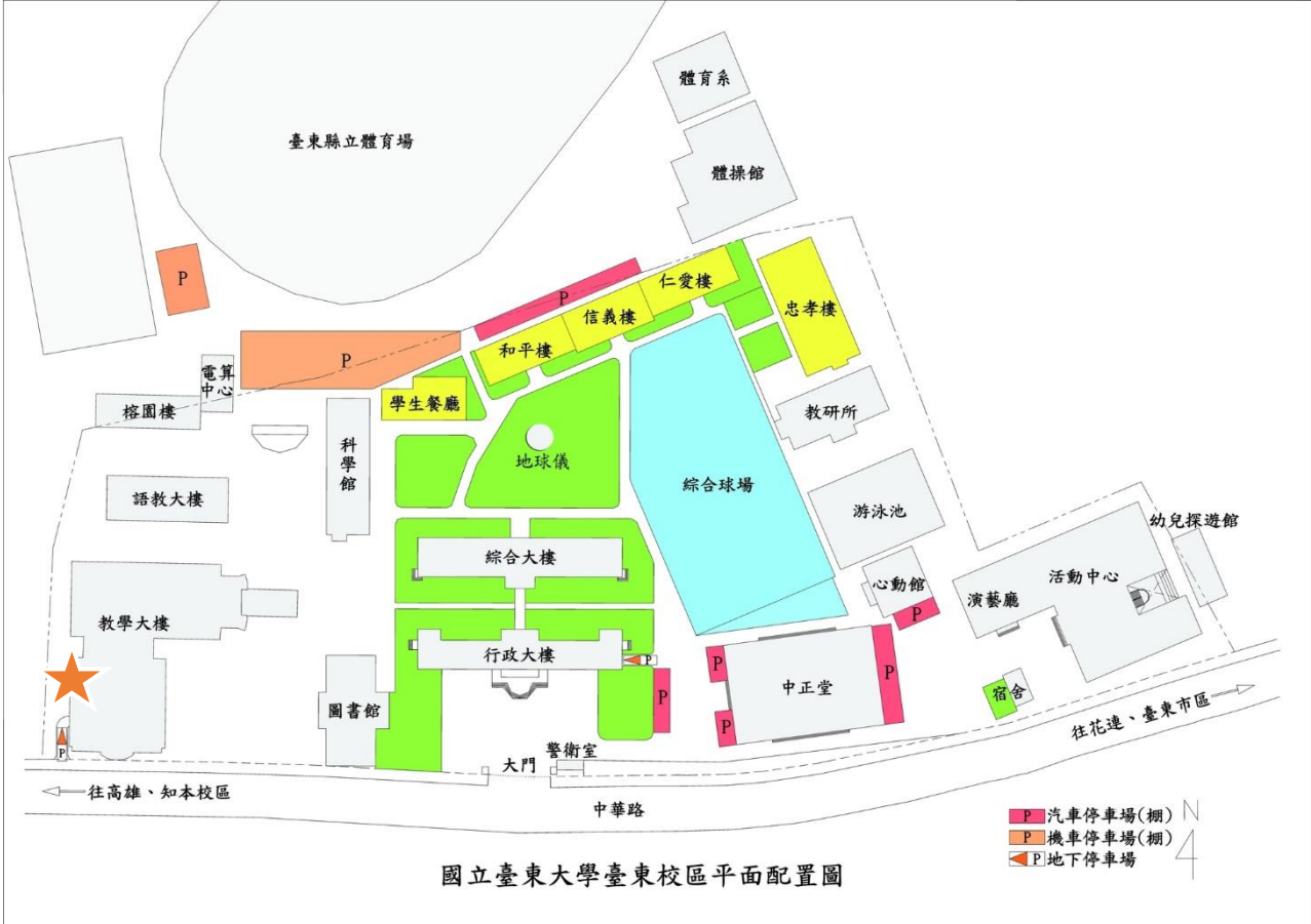
國立臺東大學臺東校區平面配置圖